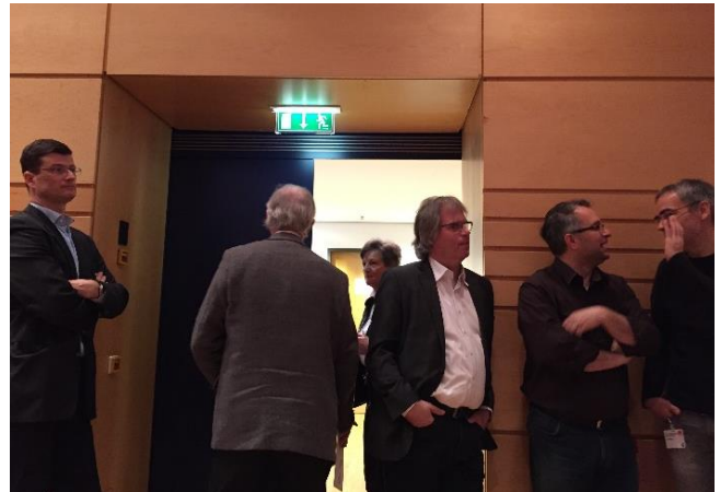
SPD-Landesparteitag in Halle 2016

Mehr Themen, Informationen und Termine finden Sie auf www.spd-dessau-rosslau.de