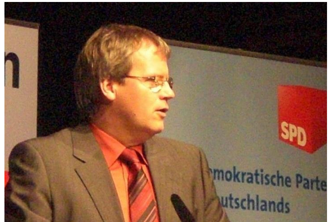
Politischer Aschermittwoch Köthen 2011