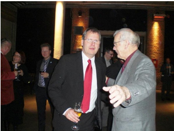
Neujahrsempfang SPD-LV, 2011