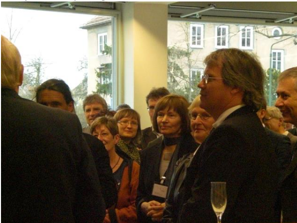
Eröffnung Bibliothek Bauhaus und HSA, 2012